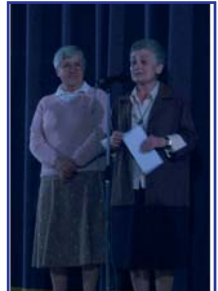
Las Hermanas Charo y Encarnita agradecen la donación.

9 de junio, en un emotivo evento donde las usuarias de CASM de Velázquez volvieron a amenizar la jornada con sus actuaciones de la Fiesta de la Solidaridad.