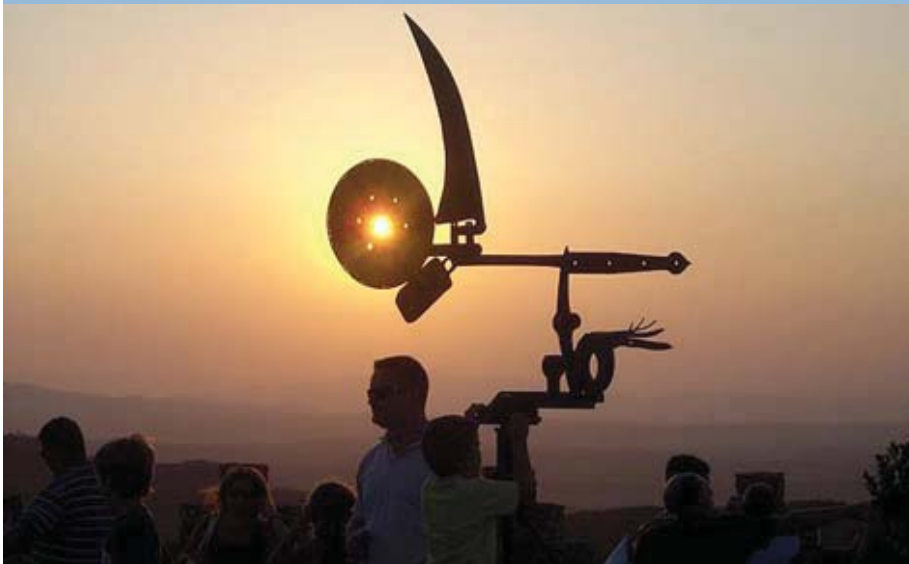
EL SOL SE PONE JUSTO DETRÁS DE LA VELETA, EN EL CASTILLO DE BEGUR (GIRONA). DAVID BARNETT.