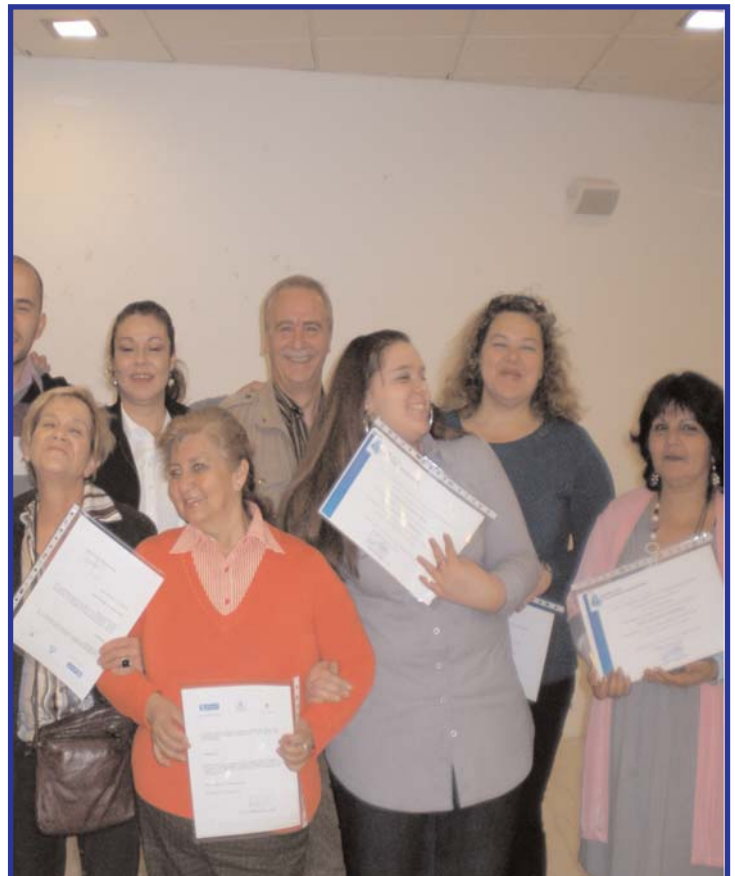
Algunos de los alumnos que han cursado el formativo gratuito en Auxiliar de Geriátrica. Enhorabuena!

Asimismo, CASM ha mostrado su satisfacción al comprobar que el 55% de los alumnos de esta edición ya han encontrado empleo.