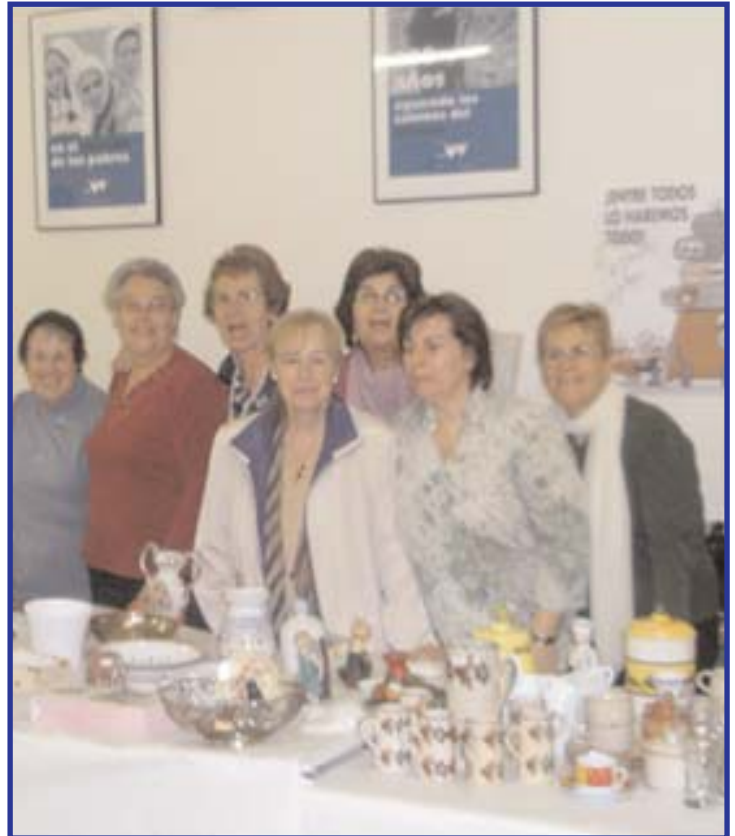
Rastrillo Solidario, en el que aportaron su granito de arena las usuarias de Laoma.

Los fondos recaudados se destinarán este año a un Instituto Médico en la India.