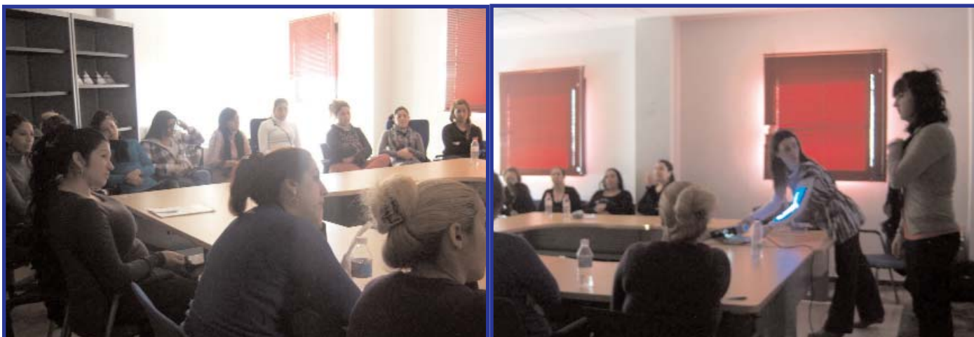
Las mujeres del proyecto de Acompañamiento socio-laboral durante la charla de nutrición, en Moratalaz.

La entidad considera que este tipo de formación debe ser parte de los itinerarios de acompañamiento social, en los que se abarcan temas que va desde la sexualidad hasta la nutrición, ya que la salud y su promoción es prioritaria.