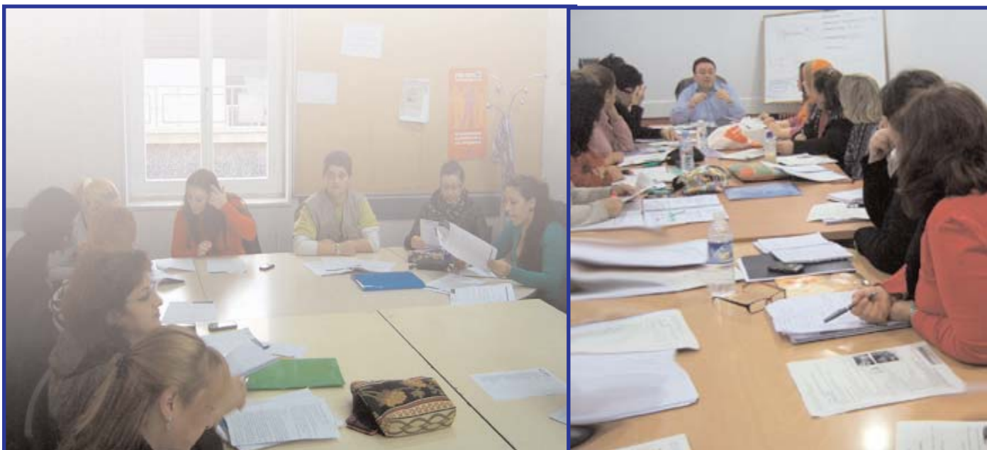
A la izquierda, alumnas del formativo ocupacional de CASM de Auxiliar de Jardín de Infancia - en Vallecas-, en su primera edición. A la derecha, los alumnos del formativo de Auxiliar de Geriatria y Dependencia - en Arganzuela-, durante una de las clases; de ellos ya han encontrado empleo seis.

Tienen una duración aproximada de tres meses e incluyen prácticas en centros homologados. Estos formativos son gratuitos, abiertos a todo el mundo - en su mayoría desempleados o personas en riesgo de exclusión social- y forman parte del programa de CASM de Apoyo y Acompañamiento Socio-laboral . Han contado con la financiación del Ayuntamiento de Madrid y de Caja Madrid.