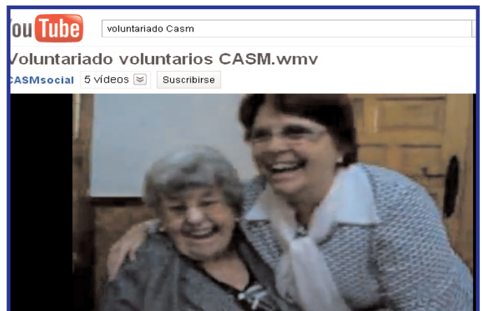
Video editado por CASM sobre el Voluntariado.

El año 2011 será el Año Europeo del Voluntariado y el décimo aniversario de la celebración del Año Internacional del Voluntariado.