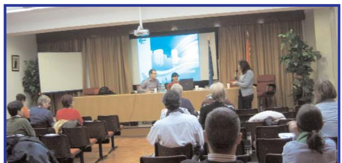
Seminario de redes sociales.

Al curso asistieron usuarios y socias de CASM, así como representantes de otras entidades. En la jornada se dieron pautas acerca de cómo hacer un uso apropiado de las redes sociales para mejorar la imagen de las entidades.