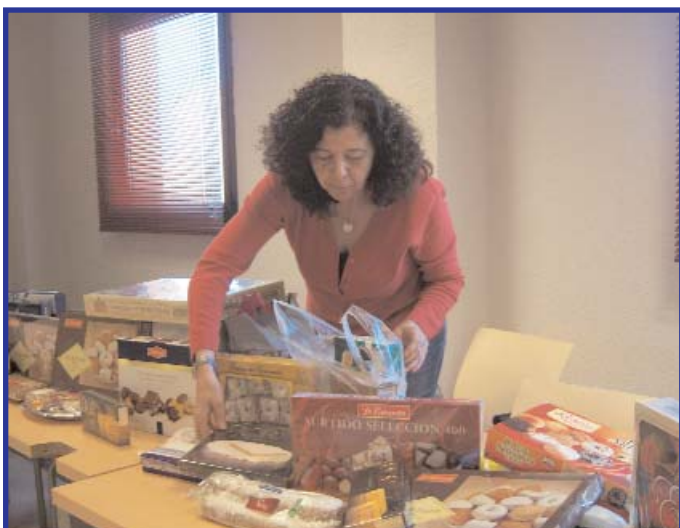
Recogida de dulces que CASM llevó al comedor social de Luz Casanova, el pasado 15 de diciembre.

Esta donación pertenece a la Campaña DonAcción , con la que periódicamente la entidad propone la recogida de productos que luego se donan a centros o personas que los necesiten.