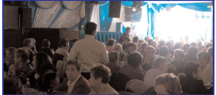
Más de 200 mujeres participaron en la Fiesta de Navidad . Arriba, una de las obras de teatro, abajo, las mujeres durante el almuerzo de convivencia.