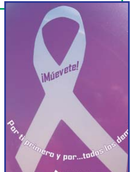
Cartel de CASM apoyando la lucha contra la violencia de género.

La justicia tiene que ser más dura con estos individuos, que se creen que la mujer es un objeto suyo. Muchas veces los juzgan y alegan que están bajo tratamiento psiquiátrico o bajo los efectos del alcohol. Hay que acabar con esta violencia contra las mujeres y que en muchos casos también la sufren los niños”.