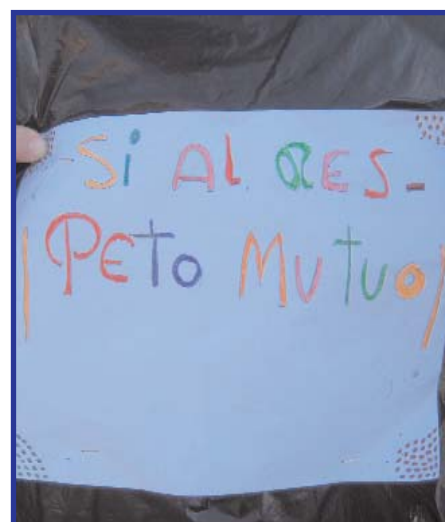
Uno de los carteles con mensaje contra la violencia machista, hecho por las usuarias de Villaverde.

"¡Aquí estamos, nosotras no matamos!", "Frente a la violencia planta igualdad" o "No te calles, ¡habla!", "Todos somos